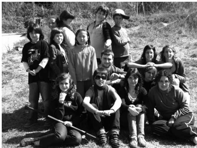
Equip “La Llufa”

Per això, els nens són capaços de transmetre'ns els seus valors i poder arribar a transformar el seu món. El MIJAC significa, abans que res, una oportunitat per a actuar que es presenta als infants, perquè ells mateixos facin efectives les seves inquietuds.