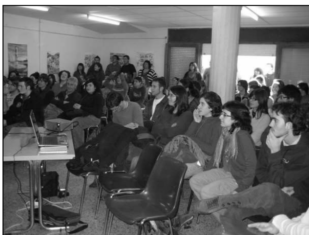
Jornada diocesana de formació al barri Mion (Manresa)

Aquest curs formem part del Mijac de la Diòcesis de Vic 12 centres: cinc del Bages (Crist Rei, Sagrada Família, Navarcles, Mió i Sant Fruitós), sis d'Osona-Ripollès